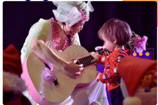
La fée des Doudous - Création pour les tout-petits