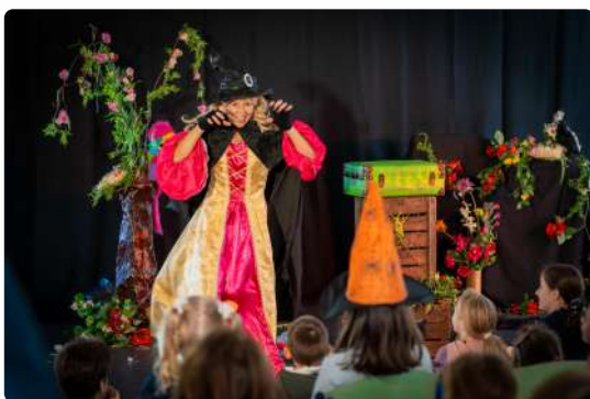
Une princesse pas sorcière - Création pour les 3 à 10 ans

Chaque spectacle est adapté à une tranche d'âge particulière, des tout petits aux plus grands.